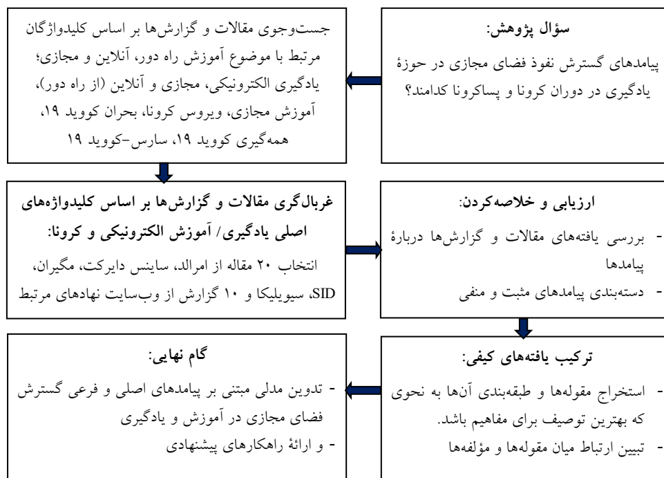
شکل ۱. فرایند انجام پژوهش به روش فراترکیب