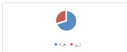
نمودار شماره ۱: نمودار فراوانی جنسیت گروه نمونه

همچنان‌که ملاحظه می‌شود تعداد مدیران مدارس زن حاضر در پژوهش ۴۰ نفر (۳۳ درصد) و تعداد مدیران مدارس مرد حاضر در پژوهش ۸۰ نفر (۷۷ درصد) است.