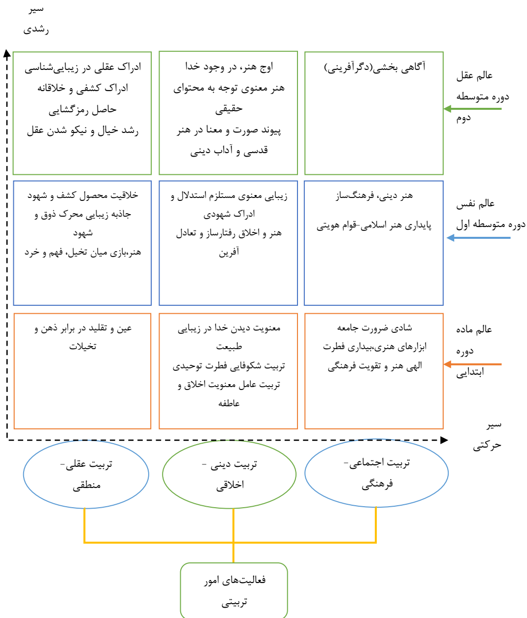
شکل ۲. الگوی فعالیت‌های امور تربیتی با فهم زیبایی‌شناختی و افق‌های تربیتی آن در دوره‌های ابتدایی، متوسطه دوره اول

در ادامه، الگوی فعالیت‌های امور تربیتی در جهت رسیدن به اهداف تربیتی در سه شاخص مهم تربیت اخلاقی، اجتماعی و منطقی در شکل ۲ آمده است. افق‌های تربیتی پیش روی هر دوره تحصیلی با فهم رویکرد زیبایی‌شناختی قابل دستیابی و برنامه ریزی می‌باشد. نتایج این نوع فعالیت تربیتی چنان که گذشت از کیفیت اثرگذار، خلاقانه و پایدار برخوردار می‌باشد. در عین حال توجه به نیازهای هر سطح تحصیلی در فعالیت‌ها می‌تواند دقت نظر مربیان قرار گیرد.