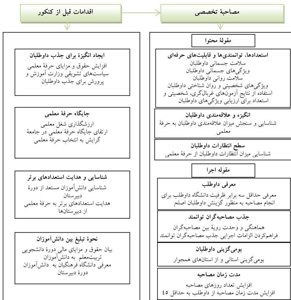
شکل ۲. الگوی نهایی فرایند مصاحبه تخصصی داوطلبان برای پذیرش در دانشگاه فرهنگیان

بر اساس نظرات متخصصان (جدول ۳)، الگوی پیشنهادی اولیه بازبینی شد. برخی زیرمؤلفه‌ها و اقدامات نیز اضافه شد، بعضی از عناوین در الگو بازبینی شد و بر اساس نظر اعضای گروه کانونی تغییر یافت. برخی مؤلفه‌ها با نظر اکثر اعضای گروه کانونی حذف شد و در برخی مؤلفه‌ها تعدیل‌هایی صورت گرفت. پس از انجام اصلاحات لازم در الگوی اولیه بر اساس نظرات اعضای گروه کانونی، الگوی نهایی تدوین شد که در شکل ۲ نشان داده شده است.