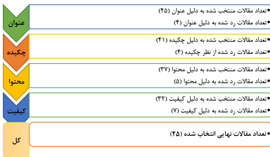
شکل ۲. روند بازبینی و انتخاب منابع مرتبط

در نهایت پس از فرآیند روند بازبینی و انتخاب منابع مرتبط ۲۵ مقاله به‌عنوان مقاله نهایی منتخب مورد استفاده قرار گرفتند. منابع استفاده‌شده برای استخراج کدها در جدول شماره ۲ نشان داده شده است.