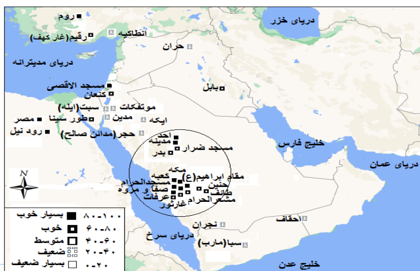
شکل ۱. نمایش سطح سواد مکان قرآنی دانشجومعلمیان بر روی نقشه جغرافیایی

از آنجایی که دانشجومعلمیان مشارکت‌کننده در این تحقیق به تازگی وارد دانشگاه فرهنگیان شده بودند و نتایج حاصل از آزمون سواد مکان قرآنی آن‌ها به‌طور عمده می‌توانست حاصل از تحصیل در دوره دبیرستان و به‌خصوص دروس تاریخ، جامعه‌شناسی و جغرافیا باشد، به بررسی سؤال سوم در این زمینه پرداخته شد. در این رابطه، میانگین و انحراف معیار به ترتیب برای سواد مکان قرآنی دانشجومعلمیان ۶۱/۱۲ و ۱۱/۸۴؛ درس تاریخ ۱۷/۰۶ و ۲/۷۷؛ درس جغرافیا ۱۶/۳۸ و ۲/۳۹ و جامعه‌شناسی ۱۶/۲۶ و ۳/۱۲ به دست آمد (جدول ۲).