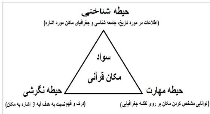
شکل ۱. نمودار حیطه‌های سه‌گانه سواد مکان جغرافیایی

با پذیرش این تعریف، بایستی برای درک مفاهیم مکانی به‌کاررفته در قرآن، از حوزه مطالعات اجتماعی نیز بهره بگیریم (شکل ۲). مطالعات اجتماعی حوزه‌ای است که مفاهیم خود را از تلفیق تاریخ، جامعه‌شناسی و جغرافیا می‌گیرد و شامل آن بخش از دانش بشری است که درباره انسان و تعامل او با محیط‌های گوناگون اجتماعی، فرهنگی، طبیعی و تحولات زندگی بشر در گذشته، حال و آینده و جنبه‌های گوناگون آن (سیاسی و اقتصادی، فرهنگی و محیطی) بحث می‌کند (فلاحیان و همکاران، ۱۳۹۱). در برنامه درسی ملی نیز حوزه‌ای تحت عنوان علوم انسانی و مطالعات اجتماعی تعریف شده که در آن بر زمینه‌سازی برای رسیدن دانش‌آموزان به درک از موقعیت و فراموقعیت در ابعاد مختلف فردی و اجتماعی تأکید شده است. قلمرو این حوزه شامل درک موقعیت و ابعاد آن در بعد زمان (گذشته، حال و آینده)، مکان (خانه، محله، شهر، کشور، زمین و کیهان)، عوامل طبیعی (محیط طبیعی و محیط زیست)، عوامل اجتماعی (ساختارها و نهادهای اجتماعی، هنجارها و رفتارها) و تعامل آن‌ها و درک چگونگی حاکمیت سنت‌های الهی بر زندگی انسان در طول تاریخ می‌شود (شورای عالی آموزش و پرورش، ۱۳۹۱).