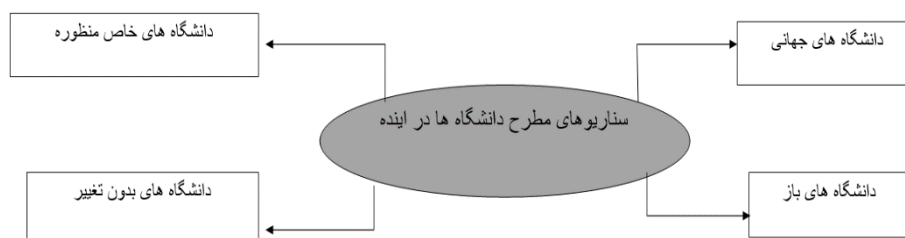
شکل ۱. سناریوهای مطرح دانشگاه در آینده (جمشیدی، یادبروقی و رضایی، ۱۳۹۷، ص ۲۵)

عسگری، فراهانی و صالحی امیری (۱۳۹۷) در پژوهشی دریافتند مؤلفه‌های محیط، دموکراتیک‌بودن، امکانات، طبقه اجتماعی، آموزش، دانش سلامتی، شناخت و مدارک تحصیلی و حرفه‌ای و دسترسی به اطلاعات و شبکه جهانی در اولویت هستند. ابراهیمی و همکاران (۱۳۹۶) رهیافت‌های آینده‌پژوهی را در سه دسته مشارکتی، راهبردی و سازمانی طبقه‌بندی کردند. شاه‌کرمی و فیض جوادیان (۱۳۹۶) در پژوهشی نشان دادند بزرگ‌ترین دستاورد دانش نوپای آینده‌پژوهی این است که فرایند تکامل آینده، پیچیده‌تر از آن است که بتوان آن را پیشگویی کرد. واعظی، قمیان و وقفی (۱۳۹۶) در مقاله‌ای پیچیدگی‌های رفتار انسان و موانع شناخت انسان را، به عنوان مهم‌ترین ملاحظات اثرگذار علوم انسانی بر فرایند آینده‌پژوهی شناسایی کرده‌اند. در این مقاله تحقق پیش‌بینی‌ها، رسیدن به آینده مورد نظر و ارتقای دانش آینده‌پژوهی، مهم‌ترین دستاوردهای تعامل دوسویه آینده‌پژوهی و مدیریت دانش حوزه علوم انسانی تشخیص داده شده است. همچنین، پیش‌بینی آینده، ایجاد تغییرات مطلوب در آینده و شناسایی عوامل تغییر، مهم‌ترین آثار ناشی از فرایند آینده‌پژوهی بر علوم انسانی قلمداد شده است. نتایج سه پژوهش یادشده به تأثیر بعد هوشیاری محیطی در مدل آینده‌پژوهی تأکید دارند.