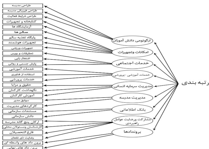
شکل ۱. الگوی مفهومی رتبه‌بندی مدارس غیر دولتی دوره دوم متوسطه نظری

پس از همسوسازی (سه‌سوسازی) ۱۰ یافته‌های سؤال نخست با چارچوب‌های نظری، تحقیقات پیشین و شواهد کارشناسان و مشارکت‌کنندگان، الگوی مفهومی اولیه‌ای از معیارها و شاخص‌های رتبه‌بندی مدارس غیر دولتی دوره دوم متوسطه نظری به دست آمد. در پایان، ارتباط عامل‌ها و شاخص‌ها با استفاده از نظرات متخصصان، بررسی شد. الگوی مفهومی پژوهش شامل ۹ معیار و ۲۸ شاخص در شکل ۱ مشاهده می‌شود.